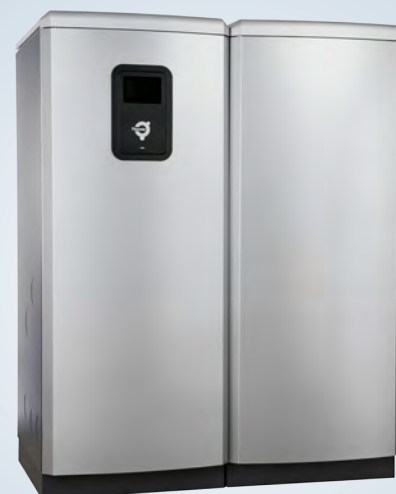
Diplomat Duo Inverter

Thermia Diplomat Duo Inverter on lämpöpumppu erillisellä varaajalla. Tämä on täydellinen kohteisiin, jossa on esimerkiksi suuri käyttövedentarve tai matala huonekorkeus.